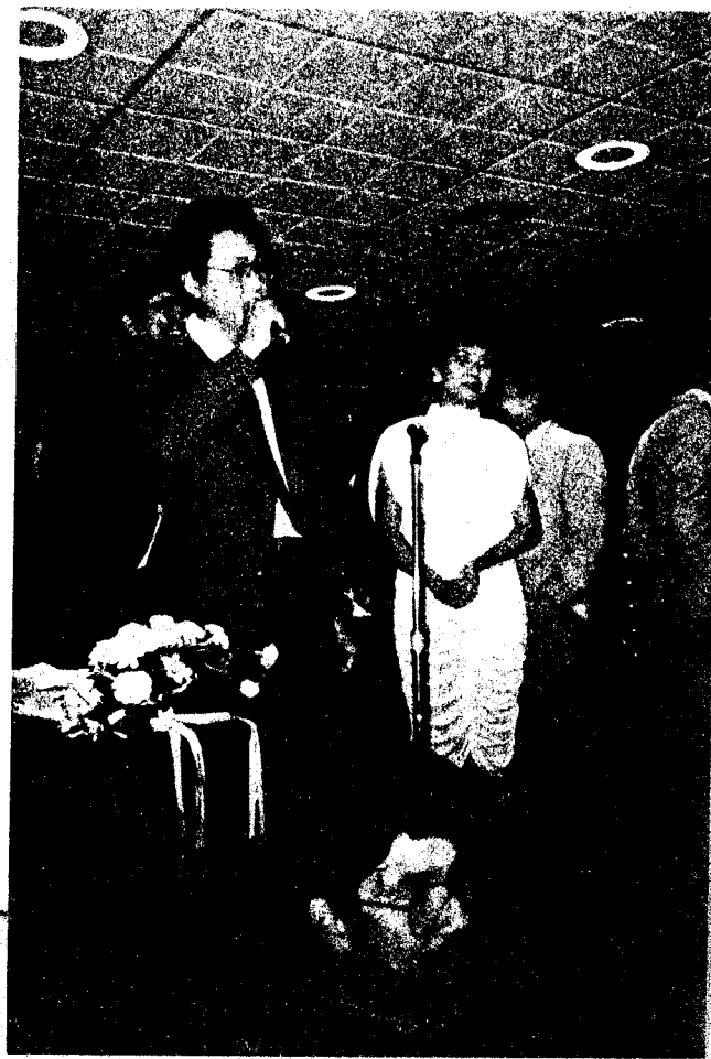
TRƯỚC "BIÊN CẢ VÀ THUY THO"